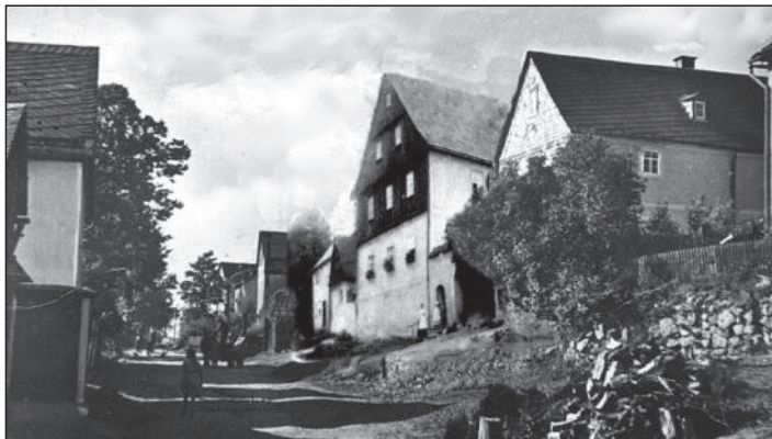
So könnte die Schönberger Straße mit dem alten Pfarrhaus um 1900 ausgesehen haben. In dieser Fotomontage wurde ein Foto des Hauses um 1908 in eine Aufnahme der Straße um 1950 eingearbeitet. Die Strommasten wurden entfernt. B.M.